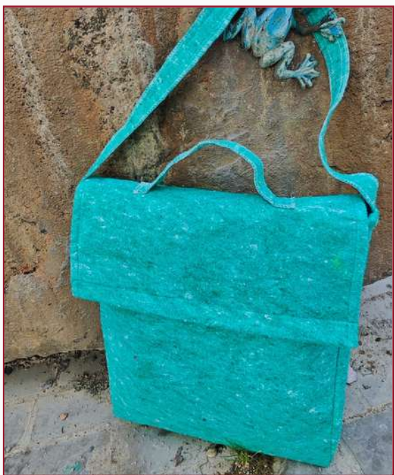
Bandolera con cierre