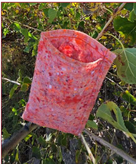
Funda para gafas