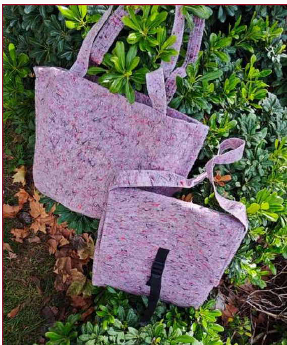
Macuto con cierre