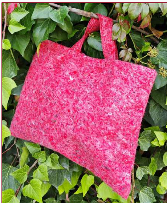
Bolsa para portátil con velcro