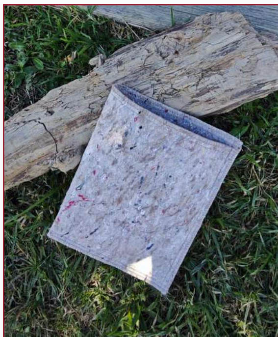
Funda para tablet