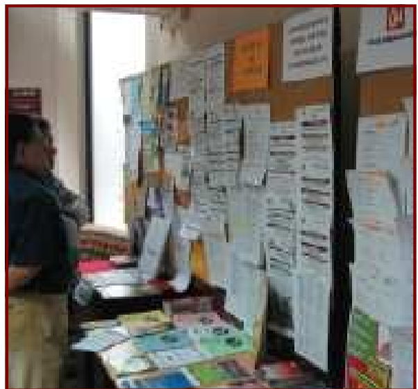
Usuarios consultan tablón de anuncios de la Fundación.

Es un servicio gratuito, ya que la financiación corre a cargo de la Comunidad de Madrid (Servicio Regional de Empleo, Consejería de Empleo y Mujer) y del Fondo social Europeo.