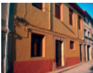
Vivienda propiedad de la Congregación de Hermanas de la Caridad de Santa Ana, que se pondrá a disposición del proyecto

Huesca - La Congregación de Hermanas de la Caridad de Santa Ana y la Fundación han firmado el martes 1 de julio, en Almedívar, un convenio de colaboración para coordinar esfuerzos y recursos con el fin de contribuir a la integración y normalización social de las personas inmigrantes de la provincia de Huesca. Mediante este convenio, las dos entidades acuerdan realizar proyectos y actividades conjuntas en los campos de la integración socio-laboral, la vivienda y la convivencia vecinal.