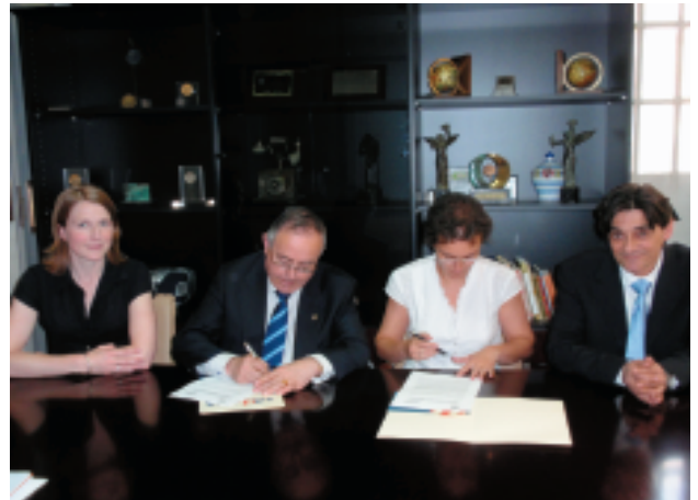
Firma del convenio de colaboración con LA ÚNICA

L as entidades firmantes comparten una serie de objetivos comunes que son: 1/ facilitar la relación entre trabajadores inmigrantes, empresas y profesionales españoles 2/ Organizar conferencias, seminarios y otros eventos, con fines formativos y de intercambio de experiencias 3/ Estudiar colaboraciones a realizar en materia de formación, charlas informativas, etc. con el fin de mejorar el potencial de los profesionales interesados en el tema de Extranjería.